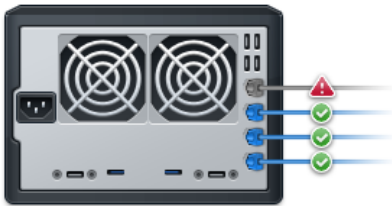
Figure 2) Résilient et fiable

Plusieurs ports LAN avec prise en charge de Link Aggregation permettent au DS1513+ d'offrir des performances supérieures.